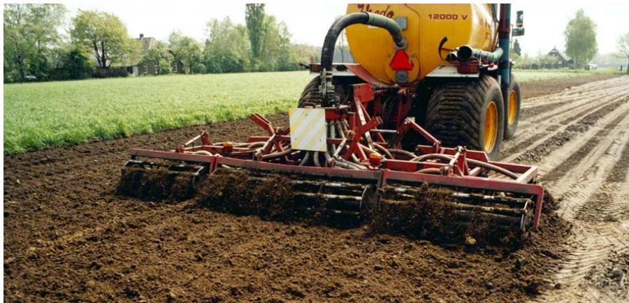
Injecteren geeft een goede mestbenutting

Ondiep inwerken kan men naast in tabel 5.20 genoemde methoden ook realiseren door diepe injectie voor het ploegen.