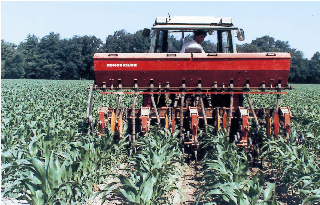
Bijbemesten is mogelijk tot het 6-bladstadium

Een Nmin-bepaling is alleen zinvol als het voorjaar uitzonderlijk koud en nat was waardoor twijfels bestaan over de beschikbaarheid van voldoende Nmin door geringe mineralisatie. Een bemesting na opkomst en vóór het 6-bladstadium is alleen lonend als de hoeveelheid Nmin lager is dan 175 kg/ha. In het algemeen wordt een strategie met gedeelde giften niet aanbevolen. De bemonstering voor de Nmin-bepaling voor het advies in juni dient 15 tot 20 cm naast de rij plaats te vinden en in het 3- of 4-bladstadium, zodat men een eventuele bemesting voor het 6-bladstadium kan uitvoeren.