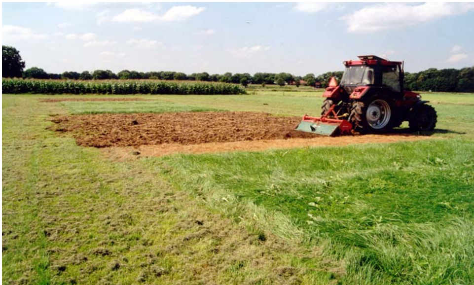
Bij scheuren komt veel stikstof vrij