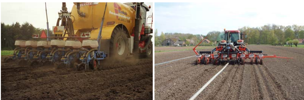
Zaaien en rijenbemesting met drijfmest in één werkgang Tegenwoordig kan dit ook in aparte werkgangen m.b.v. rtk-gps besturing

Men kan ook de drijfmest tijdens het zaaien in één werkgang toedienen. De drijfmest wordt daarbij aan beide kanten op een afstand van 8-10 cm van de rij geïnjecteerd. De machine bestaat uit een drijfmesttank waarachter een zaaimachine is gebouwd. Dit systeem is minder geschikt voor structuurgevoelige gronden. Daarom is er ook al een systeem ontwikkeld waarbij de drijfmest wordt aangevoerd met een sleepslangensysteem. Rijenbemesting met dierlijke mest geeft een betere werking van stikstof en fosfaat dan een vollevelds toediening. Evenals bij rijenbemesting met kunstmest wordt voor stikstof de factor 1,25 aangehouden. De betere werking van fosfaat is sinds 2010 in het advies geïntegreerd. Bij rijenbemesting met drijfmest is het over het algemeen niet mogelijk om meer dan 35-40 m 3 per ha netjes te injecteren. Veel loonwerkers ervaren de lagere zaaicapaciteit als bezwaarlijk. Tegenwoordig is het mogelijk om de rijenbemesting met drijfmest en het maïs zaaien in aparte werkgangen uit te voeren. De drijfmest wordt daarbij als rijenbemesting aangewend op 75 cm rijafstand m.b.v. automatische besturing met rtk-gps en deze gegevens worden daarna gebruikt door de trekker met de zaaimachine. Door deze methode is de zaaicapaciteit niet meer afhankelijk van de mest aanvoer capaciteit.