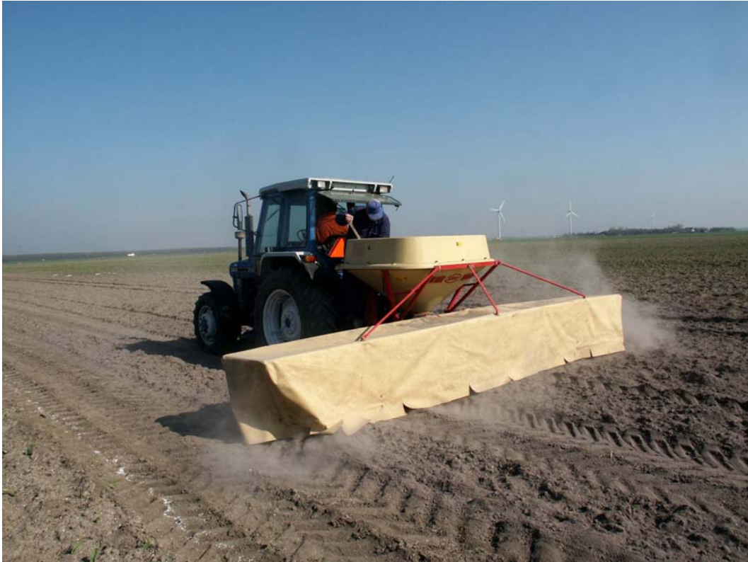
Een goede pH is een eerste vereiste

Bij giften groter dan 4000 kg nw adviseren we deze giften in meerdere keren te geven. In het algemeen worden giften groter dan 8000 kg nw niet geadviseerd. Pas vlak na een bekalking geen N-bemesting toe met een minerale meststof die ammonium bevat en/of organische mest, omdat dan extra verliezen uit deze meststoffen kunnen optreden.