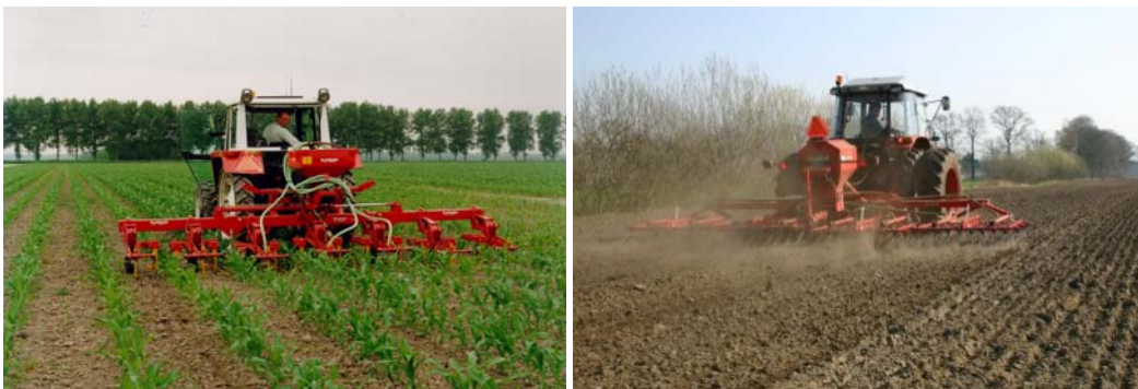
Italiaans raaigras kan in één werkgang met het schoffelen worden gezaaid (links) en Rietzwenkgras kan tussen zaaien en opkomst van de maïs met een wiedege plus zaaunit worden gezaaid (rechts)

In plaats van nateelt is het mogelijk om gras onder de maïs te zaaien. Dit beperkt de stikstofverliezen gemiddeld wat meer dan nateelt. Onderzaai kan wanneer de maïs 40-50 cm hoog is en bijna gesloten (3-4 bladstadium) met Italiaans raaigras of tussen zaaien en opkomst van de maïs met Rietzwenkgras. Bij onderzaai met Italiaan raaigras in het 3-4 bladstadium bepaalt het zaaitijdstip het succes van de teelt. Het gras moet op tijd worden gezaaid om zich voldoende te kunnen ontwikkelen, maar moet ook weer niet concurreren met de jonge maïsplanten. Men kan zaaien met een pijpenzaaimachine waarvan de pijpen boven de maïsrij zijn opgetrokken. Een andere mogelijkheid is om het in één werkgang met het schoffelen te zaaien. Per ha is 25-30 kg zaaizaad nodig. Rietzwenkgras is trager in opkomst dan Italiaans raaigras en kan daarom tussen zaaien en opkomst van de maïs worden gezaaid. Het kan gezaaid worden met een wiedege waarop een zaaunit is gemonteerd. Per ha wordt 15-20 kg zaaizaad geadviseerd. Bij onderzaai van gras dient men enigszins rekening te houden met het gebruik van verschillende bodemherbiciden bij de onkruidbestrijding. (zie hoofdstuk 8).