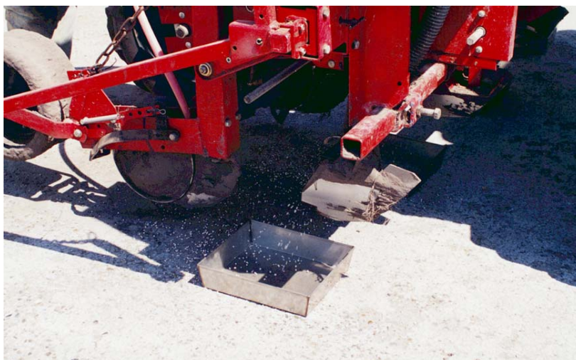
Rijbemesting stimuleert de jeugdgroei van maïs